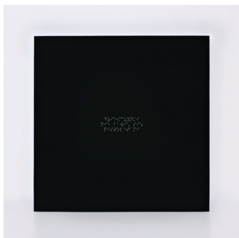
Rys. 4. Dziewczynki nie bawią się pistoletami, haft, tkanina bawełniana Fig. 4. The girls don't play with the guns, embroidery, fabric