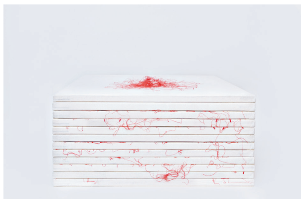
Rys. 3. Plantacja, rysunek szyty, haft, tkanina bawełniana Fig. 3. Plantation, sewn drawing, embroidery, fabric

Na innej zasadzie działam w cyklu Plantacja , gdzie czerwoną nicią „wrysowuję” jednocześnie analizując kształty płatków róż różnego gatunku, a następnie ręcznie wyhaftowuję wybrane zarysy. Jest to swoiste rosarium zapisane na kilkunastu białych, tkaninowych tablicach, gdzie poza kwadratowe płaszczyzny wylaniają się intensywnego koloru nici sugerujące, że poza obrazem jest coś więcej (rys. 3).