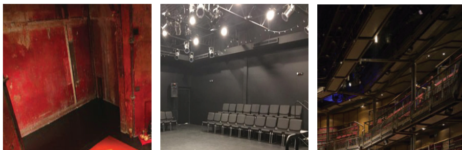
Rys. 5. Teatr Petera Brooka [ http://www.bouffesdunord.com/en/the-theater/history ]

ok, zrywając więzy z teatrem „gładkim i pięknym” i zмирzając w kierunku „teatru ubogiego” rzucił wyzwanie w swoim traktacie z roku 1968 pod tytułem The Empty Spaces (Puste Przestrzenie), zaczynając od frazy: „Mogę wziąć każdą przestrzeń i nazwać ją „gotą sceną”. Już wtedy widział nieograniczone możliwości teatru adaptacyjnego, dlatego też podkreślał, że teatr zaczął się od rytuału – obrzędku. W swoim teatrze, podobnie jak w każdym z czterech rodzajów teatru zdefiniowanych przez Brooka 5 , odchodząc od dekoracji i górnolotnej architektury, zachowując jedynie strukturę wnętrza teatralnego, stawia na ludzkie połączenie widza i aktora, a oprócz nich jedynym istotnym rekwizytem jest światło, które współczesna technologia ma potencjał zmienić w podwalinę wystroju (rys. 5).