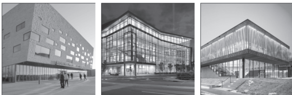
Rys. 2. Przykłady korporacyjnej architektury teatru w USA [ https://www.curbed.com/2017/3/15/14927584/best-theater-concert-opera-united-states ]