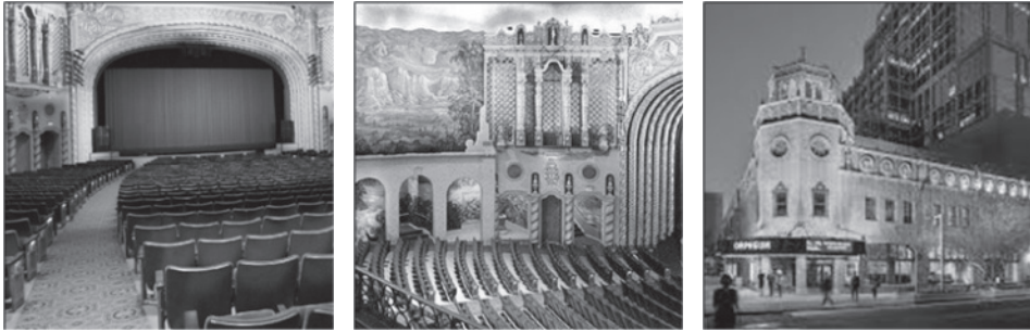
Rys. 4. Orpheum Theater