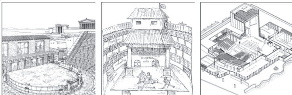
Rys. 1. Schemat teatru starożytnego, średniowiecznego oraz współczesnego [ https://www.britannica.com/art/theater-building/Developments-of-the-Renaissance ]